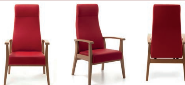
Sessel Aero ohne Griffleiste