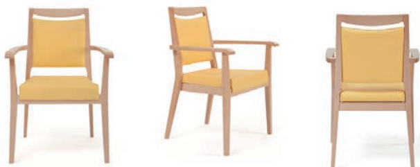
Armlehnstuhl Aero mit Griffleiste