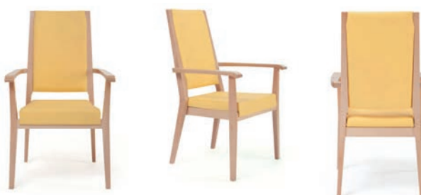
Armlehnstuhl Aero ohne Griffleiste