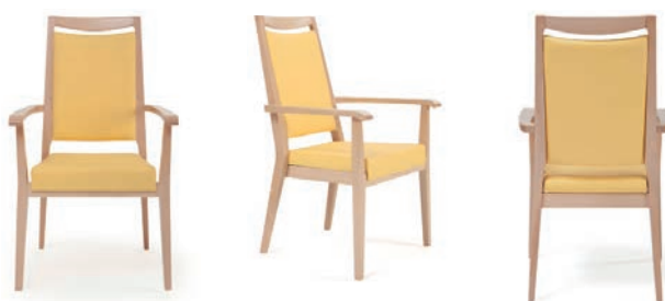
Armlehnstuhl Aero mit Griffleiste