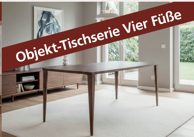
Objekt-Tischserie Vier Füße