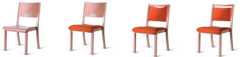
Stühle mit niedriger Rückenhöhe