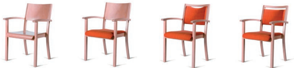
Stühle mit niedriger Rückenhöhe und Armlehnen