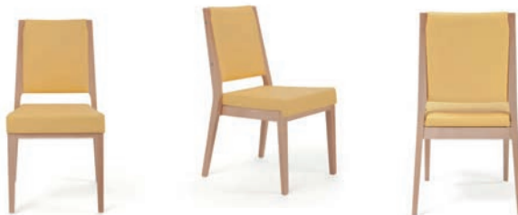
Stuhl Aero ohne Griffleiste