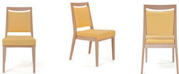
Stuhl Aero mit Griffleiste