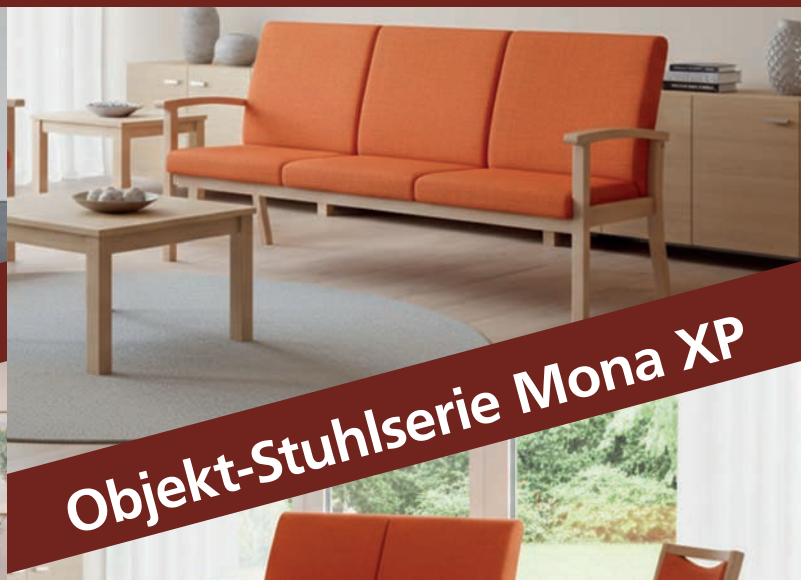
Objekt-Stuhlserie Mona XP