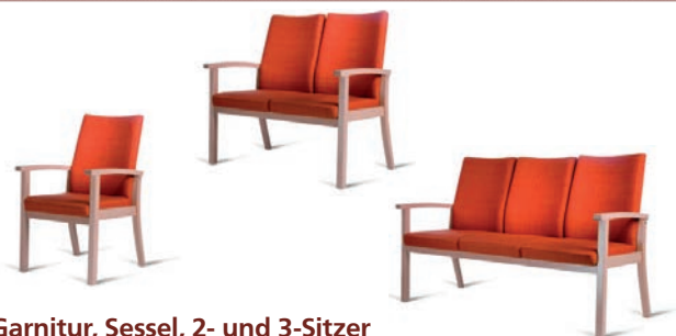
Garnitur, Sessel, 2- und 3-Sitzer