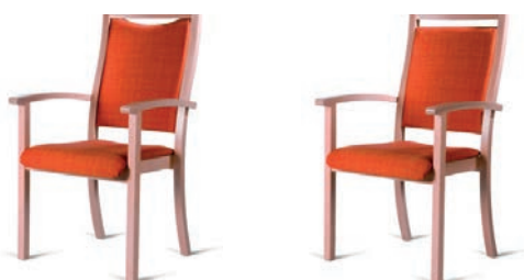
Halbhochlehner Stuhl mit Armlehnen